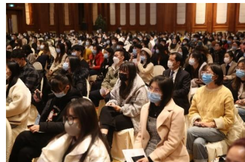
参赛选手为现场观众献上了精彩的日语演讲 现场观众认真聆听参赛者演讲