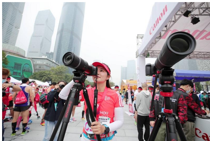
佳能展台观众专注体验EOS R5等影像新品

此次佳能赞助2020广州马拉松赛，向华南消费者传播了影像文化，传递佳能“大笑”“大健康”的企业文化，同时也为推动华南地区全民健身普及和体育运动推广做出积极贡献。