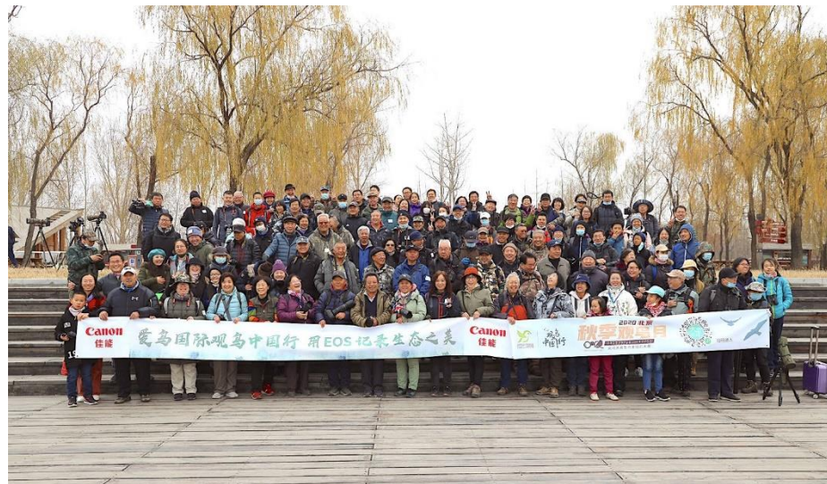
“观鸟月”活动参与者合影

作为“2020北京秋季观鸟月”活动支持企业，佳能也在活动期间，支持了北京圆明园、北京野鸭湖湿地公园拍鸟观鸟等相关主题活动。佳能（中国）深刻认识到生物多样性的重要性。除了支持此次“2020北京秋季观鸟月”活动外，佳能在公司内部也多次组织员工进行观鸟，建设专门的网页介绍观鸟、拍鸟相关信息。此外，佳能还利用世界环境日等契机，在公司内举办鸟类摄影比赛、环保知识问答等各类宣传活动，营造良好的环保氛围。